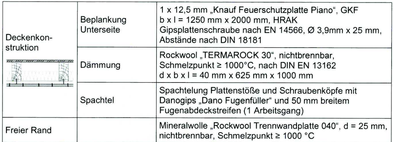
Tabelle 3: Zusammenfassung der brandschutztechnisch relevanten Konstruktionsdetails der Bodeneinschubtreppe 1 (BET 1 - Holzleiter)