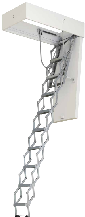
Die Bodentreppe mit TOP-Wärmedämmung und Scherentreppe aus Aluminium